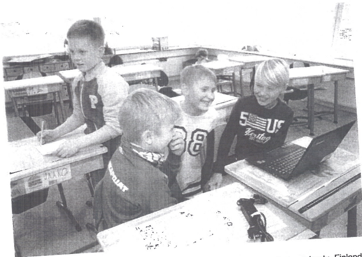
In the picture students are working on their StarT projects in Nöykkiönlaakson koulu, Finland

https://start.luma.fi/en | info@start.luma.fi | Subscribe to the StarT newsletter