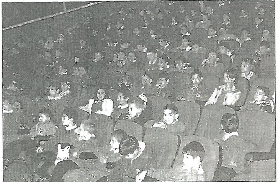
Topçular İlköğretim okulu öğrencileri İlkay Eser Tiyatrosu Yeni Meydan Sahnesi'ne konuk oldular.

Alioğlu, Perihan Karadağ ile birlikte oyunu keyifle izlediler. Topluluk halen Karadeniz turnesinde olan "Özgürlük oyunu" isimli oyunun prömiyerini de 17 Aralık'ta yapacak. Bizimkiler Trafikte isimli oyun ise, sezon sonuna dek sürecek.