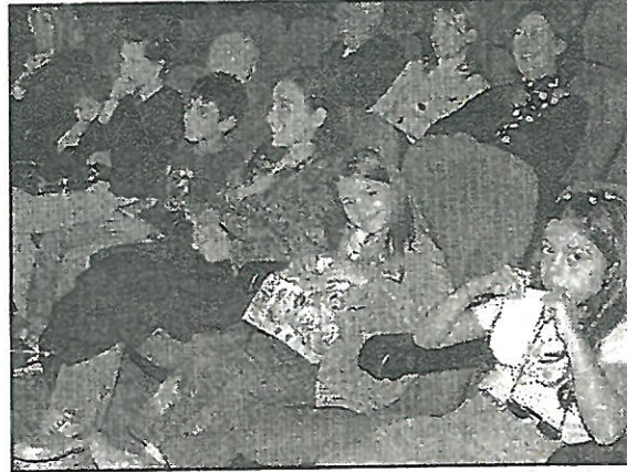
İlkay Eser Tiyatrosu'ndaki oyunun prömiyerini minikler ve aileleri büyük bir keyifle izlediler.