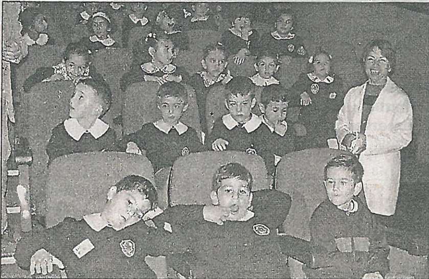
Çeşitli okulların öğrencileri eğlendirici ve öğretici oyunu ilgiyle takip ediyor. (Şennur Uzan)