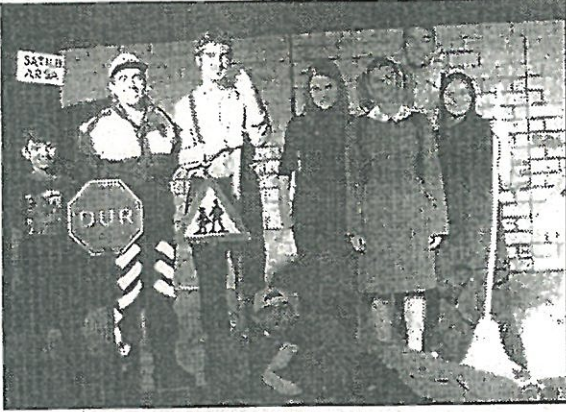
Yeni Meydan Sahnesi oyuncuları, sahnede başarılı bir performans sergilediler. (Ayşegül Kalaycı)

Çağfen Dershanesi'nin katkılarıyla gerçekleşen oyun, hafta sonları saat 13.00'te sahnelenecek.