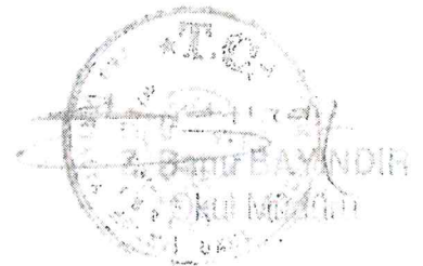
Taylan A. ULUSOY President of the General Assembly